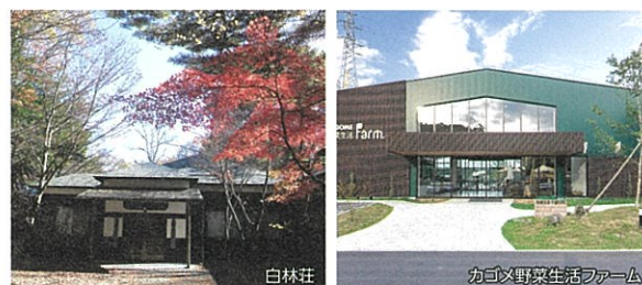
カゴメ野菜生活ファーム