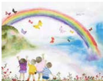
いわさき ちひろ にじのはし 1963年

● 地上絵は、 3月20日(金)から 22日(日) 12:00まで 展示します。