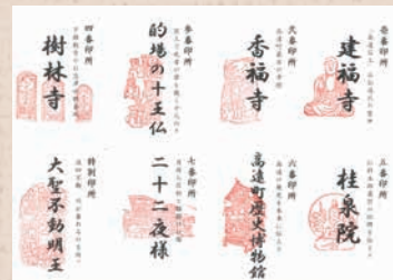
※特別印所は任意です。

※参番印所、七番印所、特別印所には御朱印を置いていないため、現地の石仏をスマホなどで撮影し、高遠町観光案内所に戻ったところで、スタッフに写真を見せて、案内所内で御朱印を押していただきます。