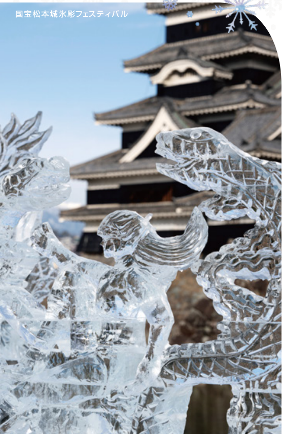
国宝松本城氷彫フェスティバル