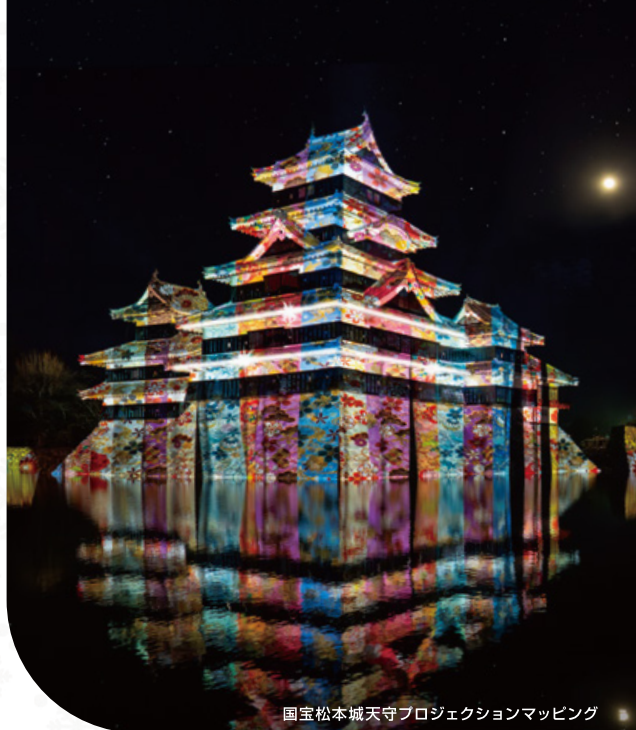
国宝松本城天守プロジェクションマッピング

国宝 松本城の天守や石垣に、葛飾北斎や歌川広重による 信州ゆかりの浮世絵をはじめ、松本城主・石川数正が描かれた屏風絵が 立体的に躍動するデジタルアニメーション、 ダイナミックで幻想的なプロジェクションマッピング映像など、 さまざまな光のアートをお楽しみください！